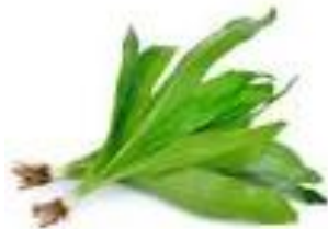
Ngò gai/mùi tàu